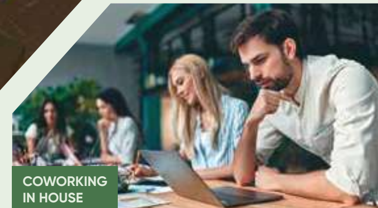
COWORKING IN HOUSE