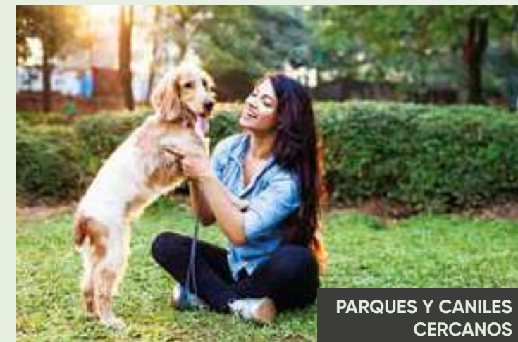
PARQUES Y CANILES CERCANOS