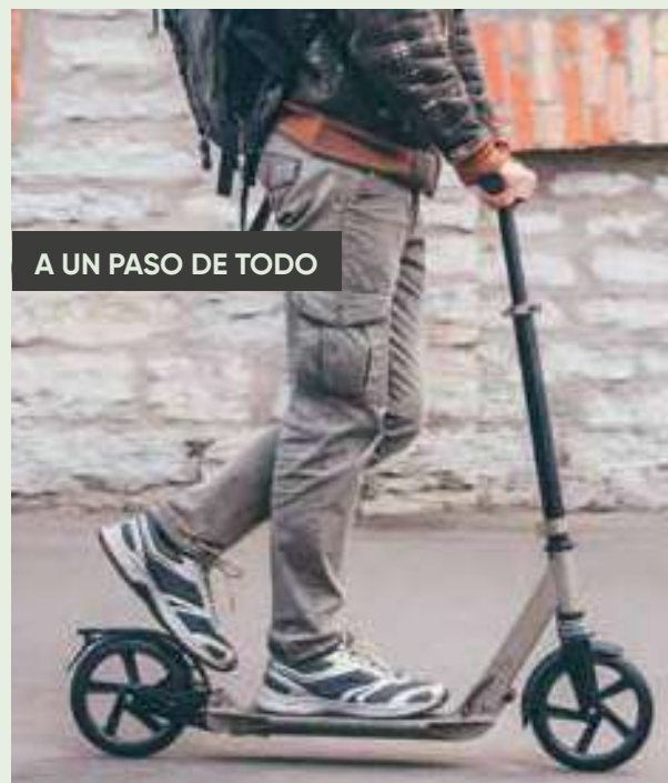
A UN PASO DE TODO