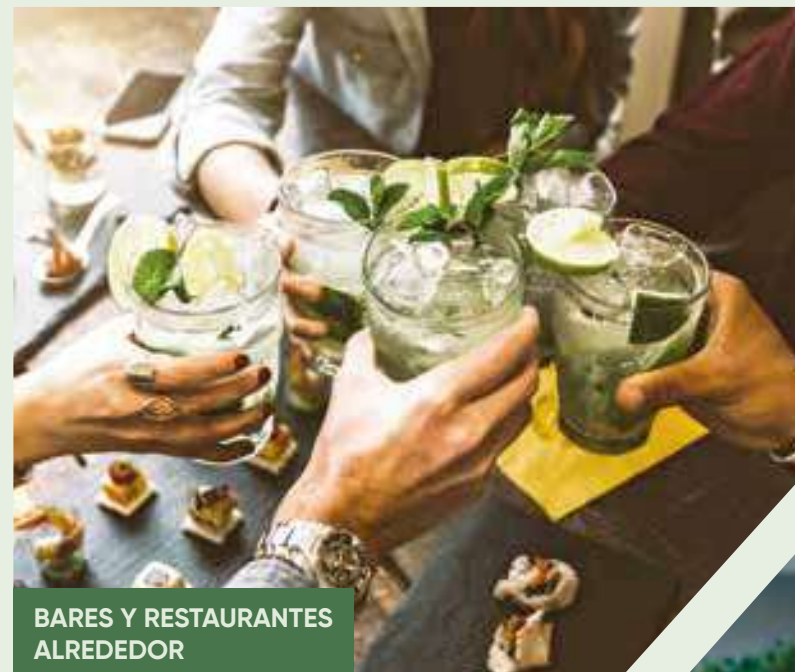
BARES Y RESTAURANTES ALREDEDOR